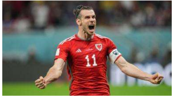
Cwis: Gareth Bale