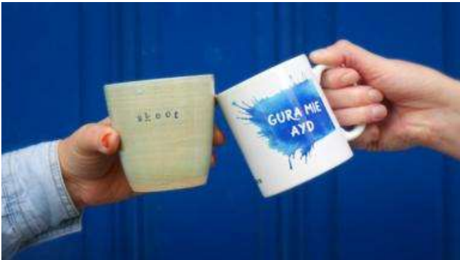
Beth yw sefyllfa'r iaith Fanaweg ar Ynys Manaw?