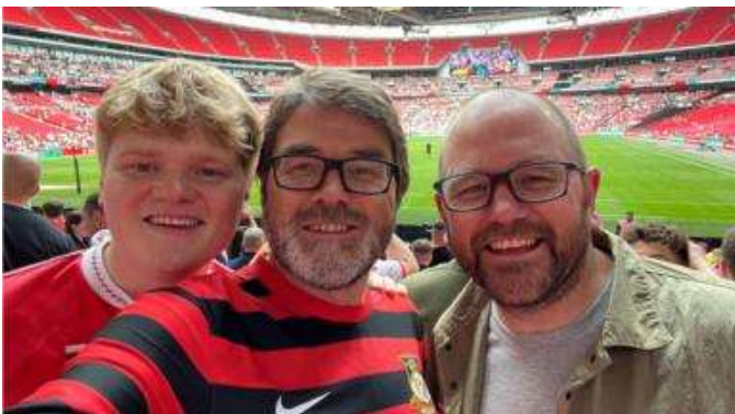
Y byd yn gwyllo Wrecsam... yn Gymraeg!