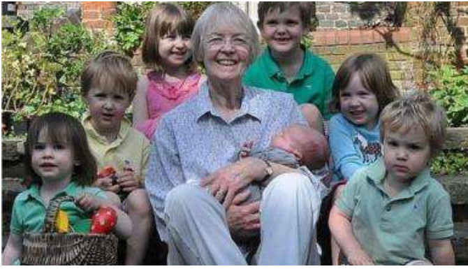
Kubrick, yr archdderwydd a'r arlunydd o Sir Aberteifi