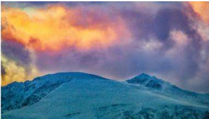
Oriel: Eira dros rannau o Gymru