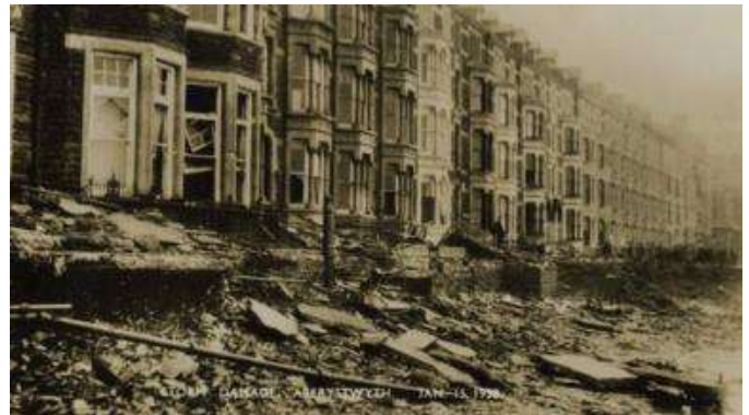
Cofio storm fawr Aberystwyth, 1938