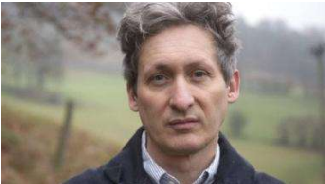
Gwreiddiau'r Cymry: 'Deuoliaeth o dristwch a balchder'